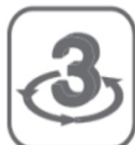
3 Jahre Garantie