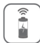
0,5W Stand by Verbrauch