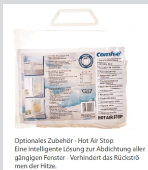
Optionales Zubehör - Hot Air Stop Eine intelligente Lösung zur Abdichtung aller gängigen Fenster - Verhindert das Rückströmen der Hitze.

Midea Europe GmbH Ludwig-Erhard-Straße 14 65760 Eschborn Deutschland +49 (0) 6196 90 20 0 info-meg@midea.com www.mideagermany.de